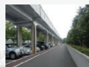
梅小路公園 おもしろい駐車場