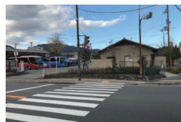
京都市嵐山観光駐車場