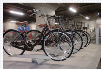
レンタサイクル「るぼるぼ」

平成26年11月から、駐車場の空スペースを活用し、レンタサイクル「るぼるぼ」の営業を直営の岡崎公園駐車場及び京都駅八条口駐車場で開始しました。平成27年4月からは市営鴨東駐車場、平成27年8月からは市営高速鉄道北山駅自転車駐車場で営業を開始し外国人をはじめ観光客の皆様にご利用いただいております。また、スマートフォンのアプリケーションを活用したシェアサイクル「P!PPA(ピッパ)」も共同事業により運用を開始しております。