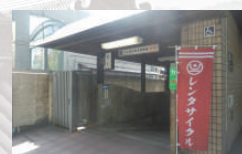
北山駅自転車駐輪場

平成31年度からの指定管理者更新により、市営地下鉄沿線の北山駅自転車駐輪場を駐輪場管理コンソーシアムにより京都市交通局から受託しております。