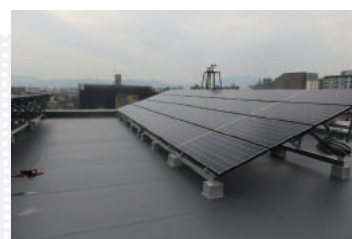
太陽光発電設備 (市立洛友中学校屋上)