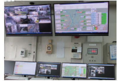
排水機場集中管理センター(洲崎排水機場)

平成26年6月から市内10カ所の排水機場保守管理業務を京都市建設局から受託し、うち2カ所については、運転監視業務を合わせて受託しておりました。平成27年度からは、10カ所全てを運転監視業務と合わせて受託したほか、京都市環境政策局が所管する「水垂排水機場」の保守・監視業務も新たに受託しました。平成28年4月からは排水機場集中監視システムが洲崎排水機場に導入され、京都市建設局から受託している11機場について遠隔監視が可能になりました。また、平成28年9月からは東松ノ木排水機場についても保守・監視業務を行っております。