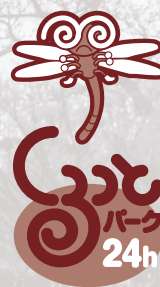
「くるっとパーク」 ロゴマークデザイン