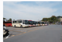
清水坂観光駐輪場