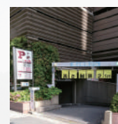
京都駅八条口駐車場