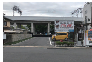
くるっとパーク京阪淀駅北

⑥壬生駐車場でのLED照明設置に加え、円山駐車場の一部と京都駅八条口駐車場及び岡崎公園駐車場の照明を全てLEDに変更しております。また、梅小路公園駐車場及び紫明通駐車場においては、太陽光発電によるLED照明を設置しております。