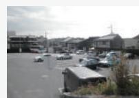
銀閣寺観光駐輪場