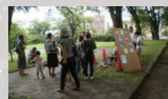
カブトムシとり大会