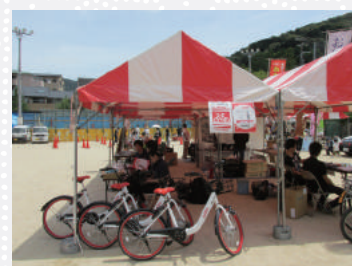
交通安全フェスタ2018